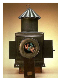
Lanterne magique, Inv. 16528

Comment donner l'illusion du mouvement à partir d'images fixes ? La visite retrace les différentes étapes qui ont été parcourues de la projection de dessins peints à la main jusqu'à l'invention du cinématographe des frères Lumière.