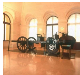
Fardier de Cugnot, Inv. 00106

Si le nom de certains inventeurs, comme Blériot ou Watt, semblent incontournables dans l'histoire des sciences et techniques, d'autres moins connus méritent également le détour : tels Conté ou Cugnot. Durant la visite, les participants découvrent différents espaces thématiques du musée.